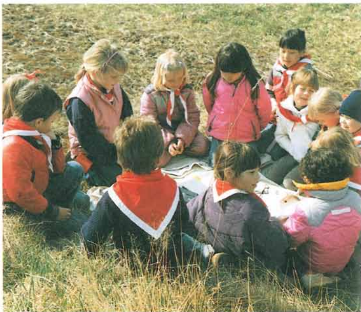
Mikroflokk – her begynder demokratiet.

At have en holdning og ikke tage stilling i partipolitiske anliggender har gennem flere år skabt en usikker situation: hvornår kan korpset, eller dele af korpset, udtale sig på vegne af DDS?