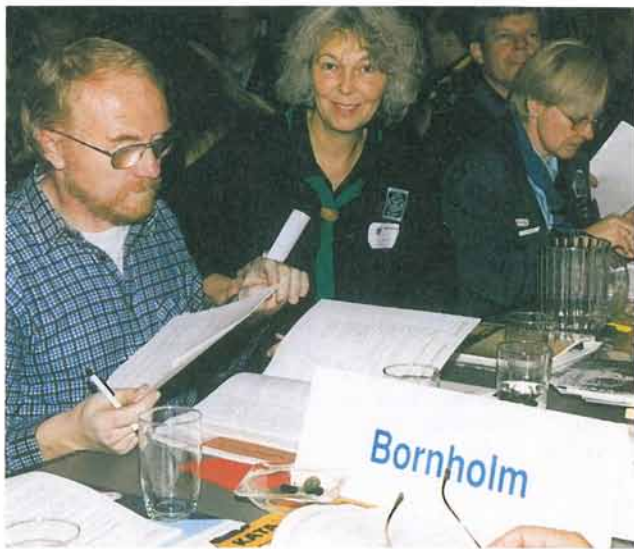
Korpsrådet er korpsets øverste organ. Her vedtages love og planer for korpsets arbejde.

“Alt er politisk”, siger nogle, og derfor er alt hvad vi gør – eller ikke gør – politisk. Andre mener at vi kun kan udtale os når det gælder spørgsmål der hersker “bred politisk enighed” om. For andre er det slet ikke afgørende at kunne udtale sig. De mener at udviklingen af den enkelte spejder vil have politisk effekt på længere sigt. Men uanset denne debat, tager DDS stilling i en række sager. Nogle gange alene, andre gange i samarbejde med andre organisationer. Som medlem af Dansk Ungdoms Fællesråd, DUF, tager DDS stilling til emner som ungdomsboliger og u-landshjælp.